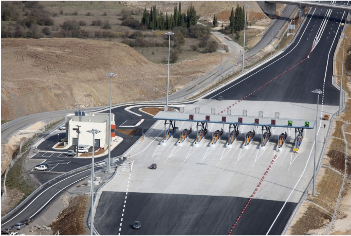
Frontal Toll Post Asea