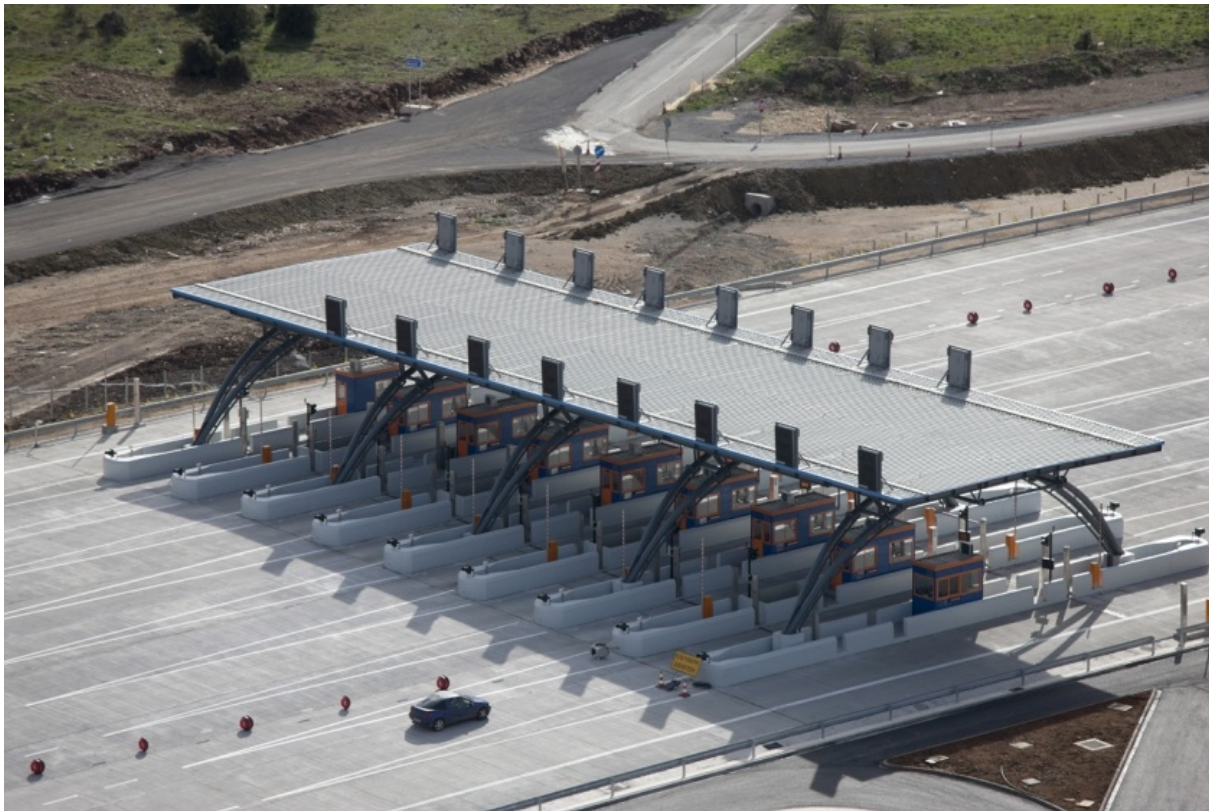
Frontal Toll Post Asea