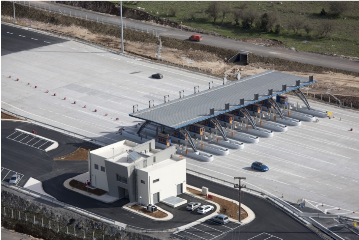
Frontal Toll Post Asea