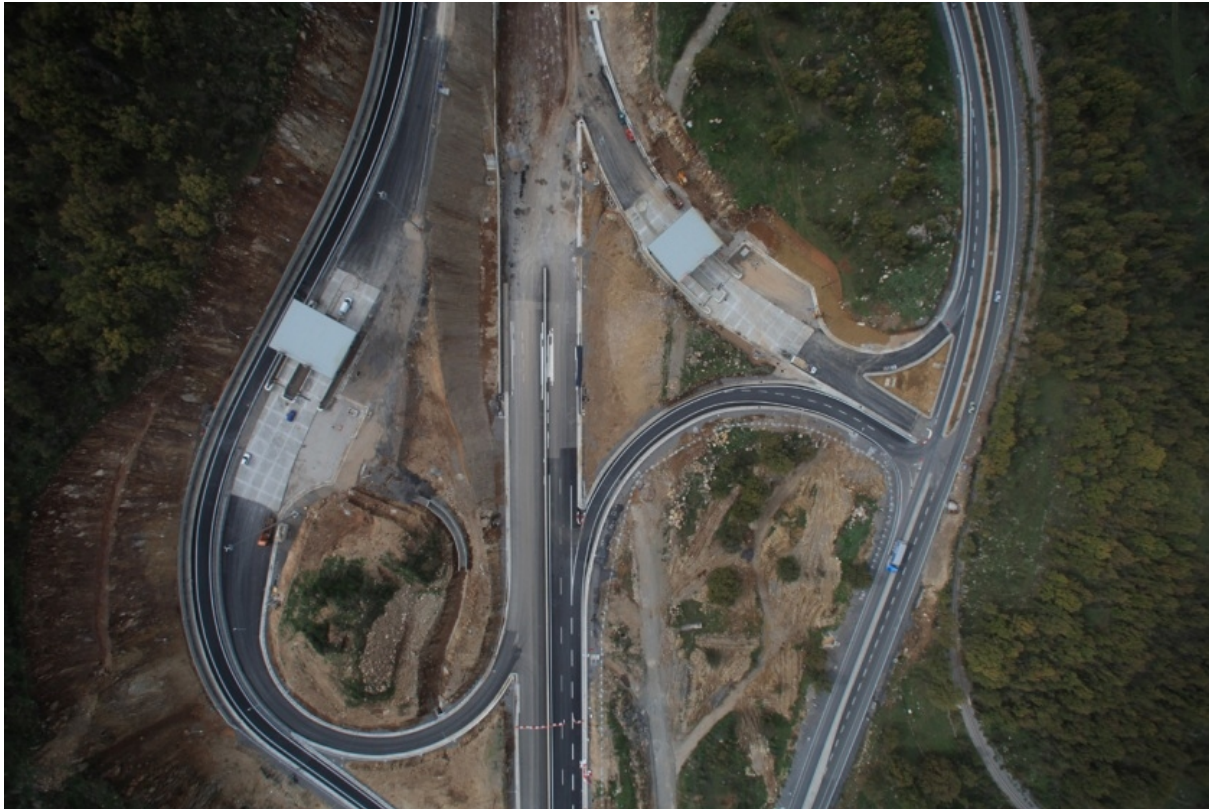
Frontal Toll Post Lefktro