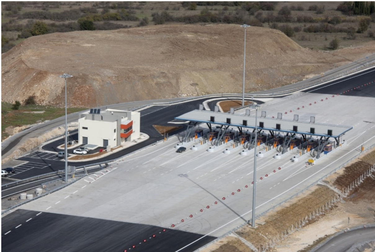
Frontal Toll Post Asea